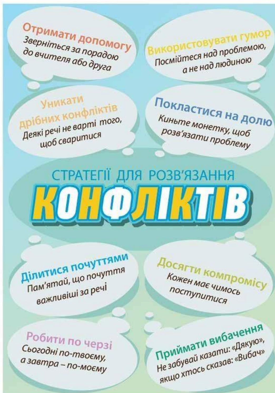
Рис. 1.2. «Стратегії для розв'язання конфліктів»