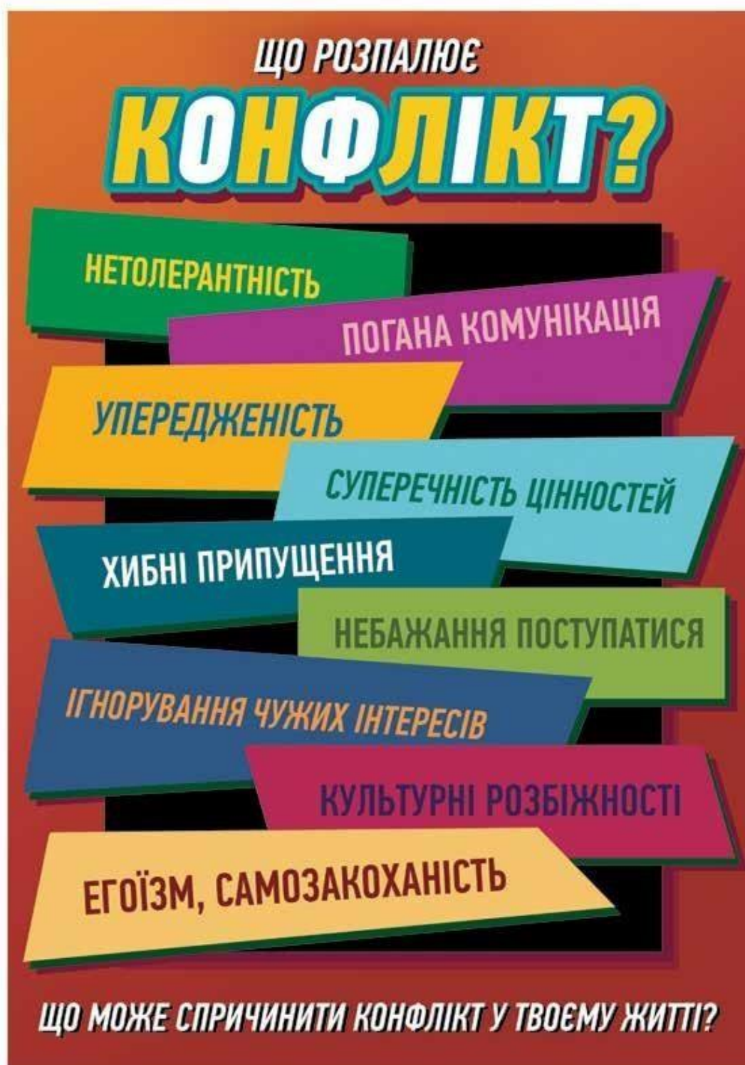
Рис. 1.1. «Що розпалює конфлікт»