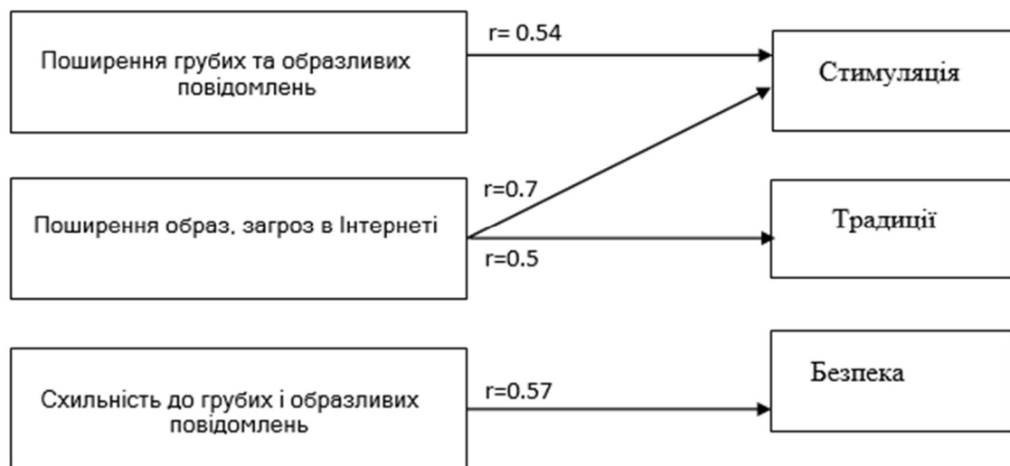
Рис. 3.2. Зв'язки між показниками досвіду кібербулінгу та ціннісними орієнтаціями

Можна припустити, що «нервовість» підлітка, яка очевидна для оточуючих в оффлайн-або онлайн-спілкуванні, провокує інших поширювати про нього неприємні чутки. Внутрішня напруга підлітка не дає йому стриматися у вираженні негативних почуттів до інших, та це проявляється у грубих висловлюваннях.