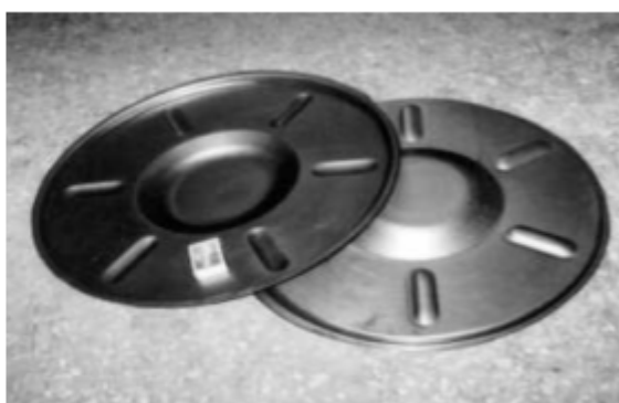
Рис. 4. Опытная оснастка для изготовления и рельефные детали

При изготовлении фрагментов использованы специальные технологические приемы, позволяющие снизить деформации и улучшить качество деталей.