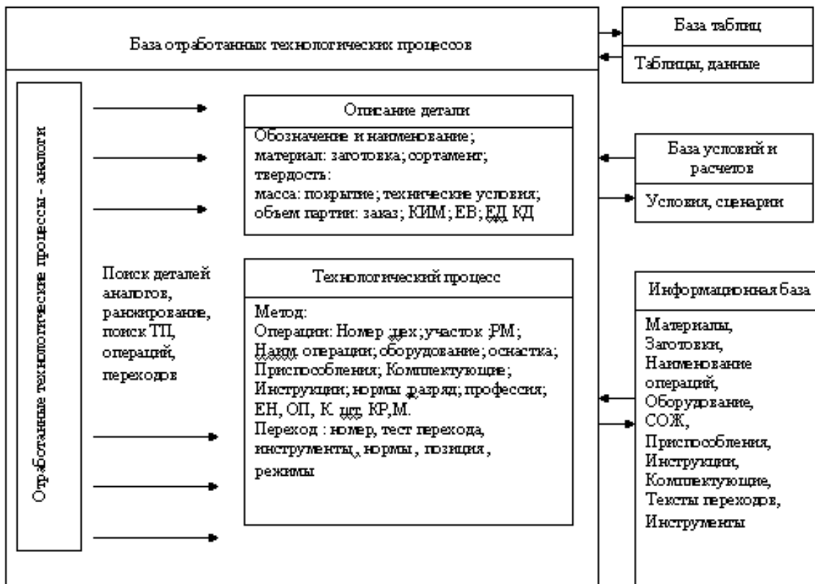
Рис. 1. Схема построения технологического процесса методом адресации

тод синтеза (при достаточном объеме информации, т.е. выборке). Хотя метод адресации может дополнять его благодаря использованию компонентов ТП – аналогов на различных уровнях декомпозиции для синтеза ТП. На рис.1 изображена схема использования методов синтеза и адресации для решения задач построения технологических процессов импульсной обработки.