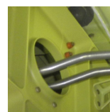
Рис. 2. Технологическое отверстие в силовом эл-те.

Система формирует два КТК для двух вариантов детали с разными радиусамигиба (рис 3). Два кода будут отличаться 4 знаком (радиусгиба) и, зависящего от него, 10 знаком (длина прямых участков). Согласно оценочным таблицам система подсчитывает две оценки технологичности – Z_1 для