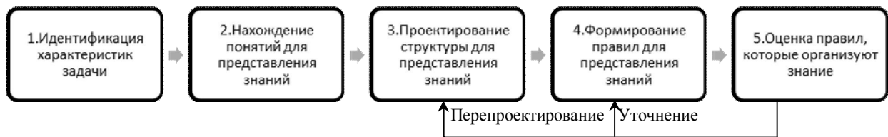
Рис. 2. Этапы проектирования ИИС

ние на проектируемую ИИС, ограничивается круг пользователей системы.