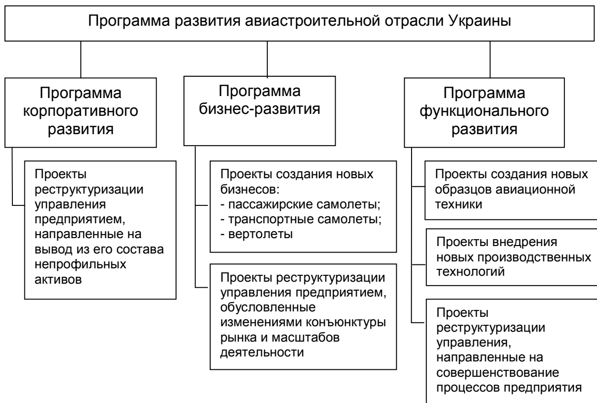
Рис. 1. Структура программы развития авиастроительной отрасли Украины

Значения KPI определяют с учетом выделенного отчетного периода (год, квартал, месяц). Обычно результат деятельности предприятия в целом оценивают на основе финансовых показателей, с которыми должны быть связаны все остальные ключевые показатели результативности через какую-то последовательность промежуточных параметров. Например, рентабельность продаж зависит от величины операционной прибыли, которую определяют объемом продаж и себестоимостью продукции. В свою очередь себестоимость продукции составляют затраты на НИОКР, производственные и управленческие затраты, а на объем продаж влияет уровень лояльности клиентов.