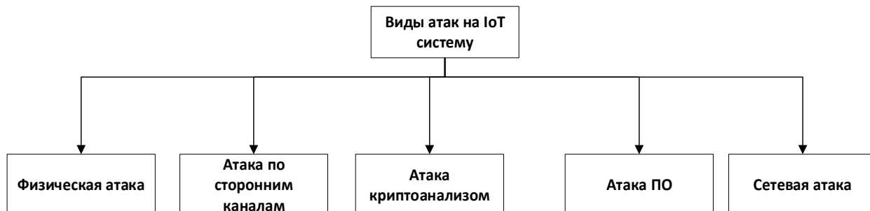
Рисунок 2 – Виды атак на IoT систему

Далее представлено описание атак с более детальным объяснением.