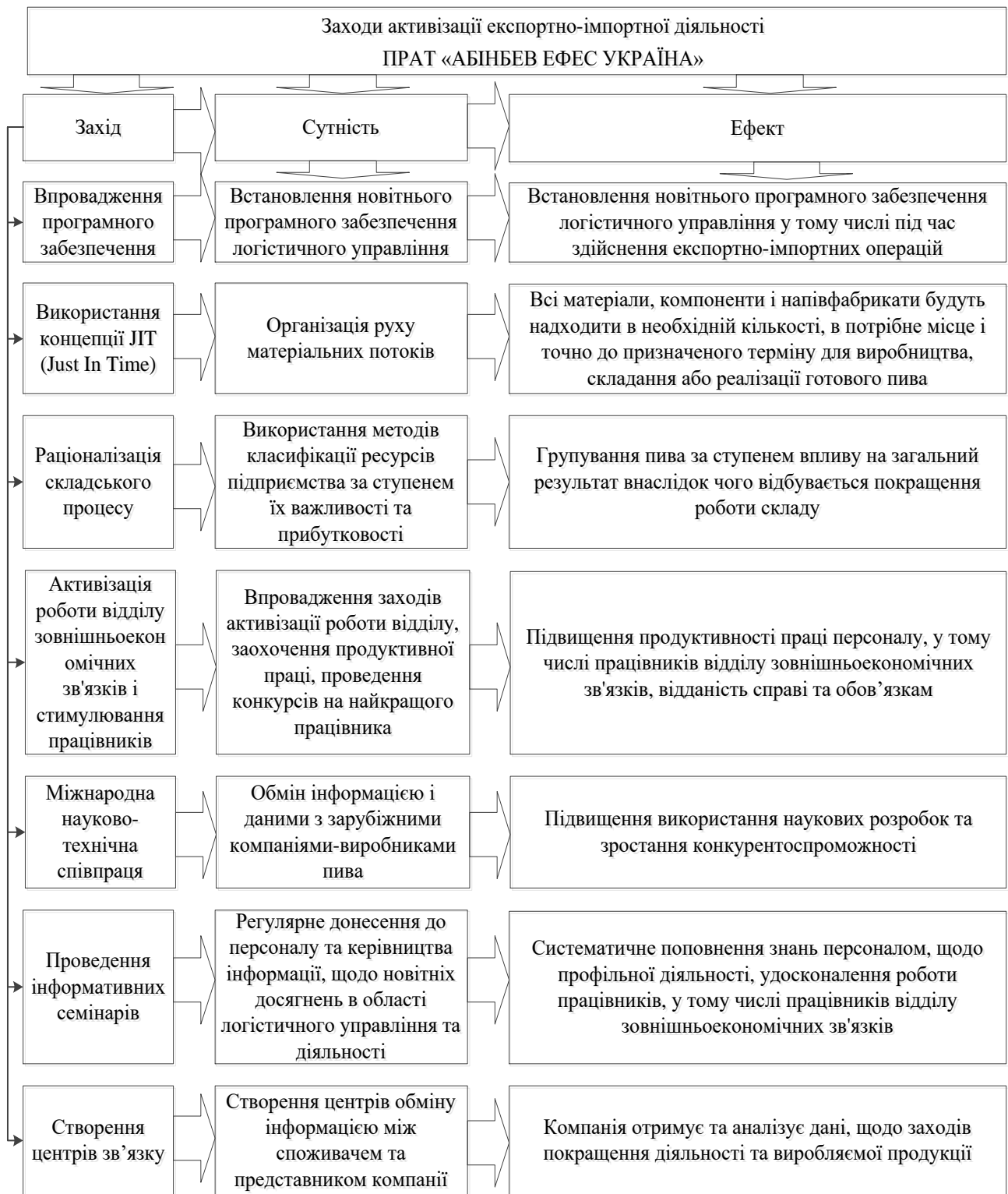
Рисунок 2 – Заходи активізації експортно-імпоротної діяльності ПРАТ «АБІНБЕВ ЕФЕС Україна»