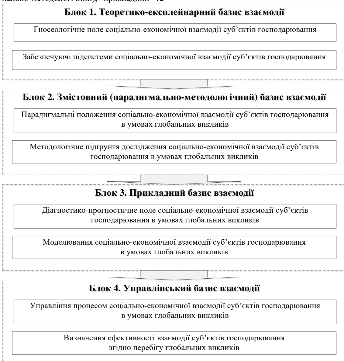
Рисунок 1 – Послідовність дослідження соціально-економічної взаємодії суб'єктів господарювання в умовах глобальних викликів

Блок 1. Теоретико-експлейнарний базис взаємодії суб'єктів господарювання, зміст якого наведено на рисунок 2, включає дослідження гносеологічного поля соціально-економічної взаємодії суб'єктів господарювання та забезпечуючих підсистем соціально-економічної взаємодії суб'єктів господарювання в умовах глобальних викликів.