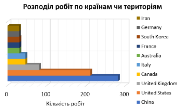
Рис. 4. Аналіз розповсюдження документів по країнам

Успішна реалізація енергетичних надкритичних циклів CO 2 вимагає високої ефективності компресора як у проектній точці, так і в широкому робочому діапазоні, щоб максимізувати потужність циклу та підтримувати стабільну роботу перехідних процесів і умов роботи з частковим навантаженням. Ця вимога особливо актуальна для циклів з повітряним охолодженням, де густина на вході у компресор має значну залежність від температури на вході, яка піддається щоденним і сезонним коливанням, а також перехідним процесам [6].