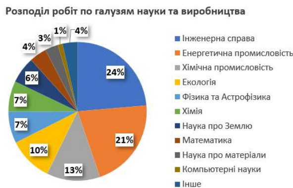
Рис. 2. Аналіз документів по сфері застосовності

Було проведено аналіз п'яти найбільших джерел для публікацій, пов'язаних з дослідженнями надкритичних циклів з двоокисом вуглецю. Як показано на рисунку 3, переважна кількість документів була представлена та опублікована у джерелах the ASME Turbo Expo, Energy, Applied Thermal Engineering. Це відповідає важливості технології в енергетичній сфері.