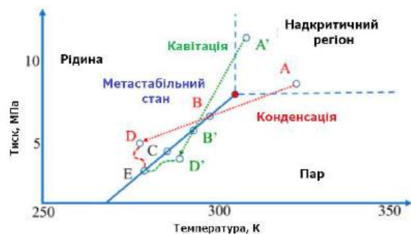
Рис. 5. Метастабільний стан та зміна фази для двооксиду вуглецю