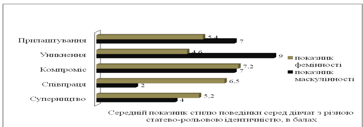
Рисунок 3.2 – Середній показник стилю поведінки серед дівчат з різною статево – рольовою ідентичністю

Стосовно отриманих результатів серед дівчат-підлітків, то у дівчат з маскулінними якостями переважає такий тип поведінки, як уникнення (9.0 ± 0.3), у дівчат з домінуючими фемінними рисами переважає тип поведінки - компроміс (7.2 ± 0.3), андрогінних дівчат у вибірці не виявлено. Так, для дівчаток характерні більш виражені емоційна сприйнятливості і реактивність, більш гнучке пристосування до конкретних умов, велика комфортність поведінки, схильність апелювати до суджень дорослих, більш старших, до авторитету сім'ї, прагнення опікувати молодших. У дівчаток значно вищий інтерес до своєї зовнішності. Специфіка статевої поведінки виражається в поєднанні кокетства з сором'язливістю і соромливістю.