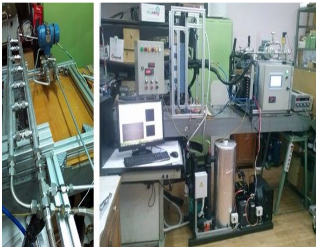
Рис. 2. Испытуемый образец коллектора и общий вид экспериментальной установки

Путевые потери давления можно оценить, используя гомогенную модель двухфазного потока [3]: